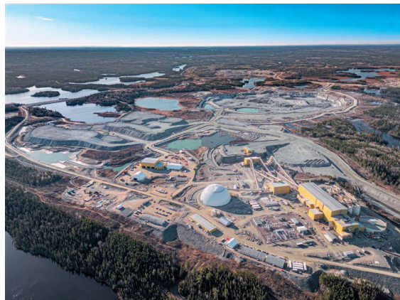
コテ金鉱山（カナダ）