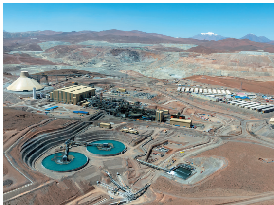
ケブラダ・ブランカ銅鉱山（チリ）

また将来の持続的成長にむけた鉱源確保についても、環太平洋地域を中心に引き続き進めてまいります。