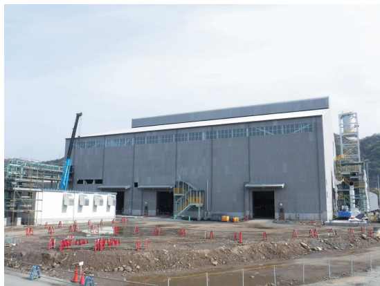
建設中のリチウムイオン二次電池リサイクルプラント （東予工場（愛媛県））

機能性材料事業では、AI関連での需要が引き続き見込まれることから、高度情報通信機器の基幹部品であるファラデーローテータをはじめとする各種製品の販売拡大を図ってまいります。また、近赤外線吸収材料の展開領域を素材テクノロジーブランド「SOLAMENT ® 」によりさらに拡大するほか、パワー半導体分野で使用される貼り合せSiC（シリコンカーバイド）基板の本格販売を進めてまいります。