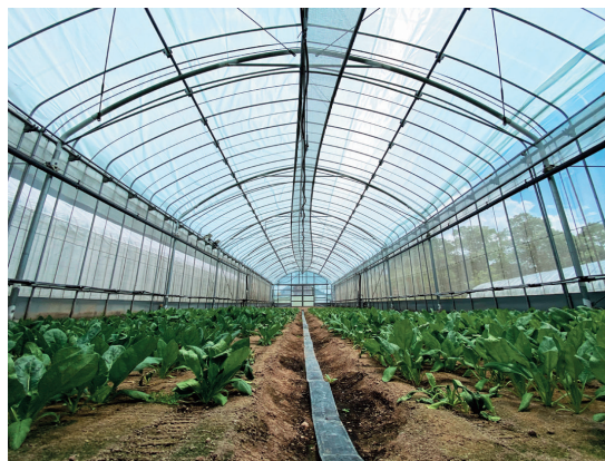
近赤外線吸収材料「SOLAMENT ® 」活用例 （農業用ビニールハウスの遮熱ネットに使用）