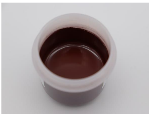
厚膜導電性インク