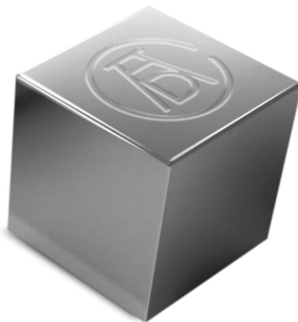
ADC 賞 Silver Cube

住友金属鉱山は、今後も社会課題解決に貢献する素材として SOLAMENT の様々な領域での展開を加速させてまいります。